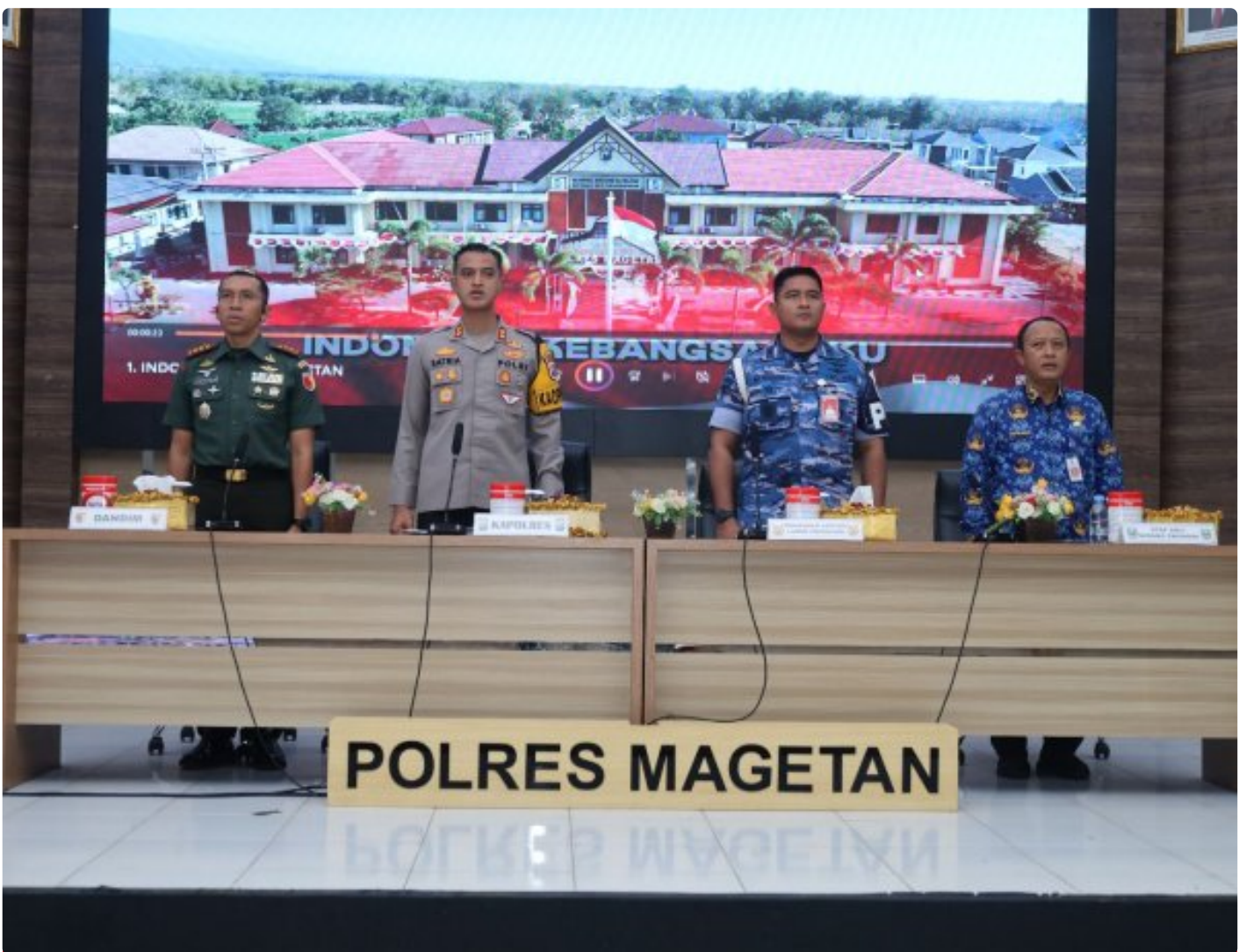
Dandim 0804/Magetan Hadiri Rakor Lintas Sektoral kesiapan operasi lilin 2024

Magetan. – Guna meningkatkan Sinergitas dalam rangka kesiapan operasi lilin 2024 pengamanan Hari Raya Natal 2024 dan Tahun Baru 2025 di wilayah Kabupaten Magetan yang aman dan kondusif.